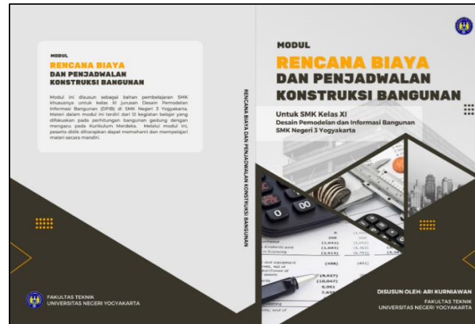
Gambar 2. Cover Modul RBPKB