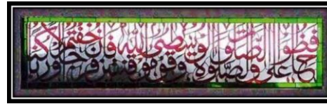
Ornamen Kaligrafi Q.S Al- Baqarah ayat 238-239