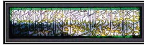
Ornamen Kaligrafi Q.S. An-Nisa ayat 103