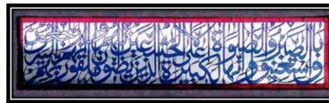
Ornamen Kaligrafi Q. S Al- Baqarah ayat 45-46