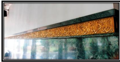
Ornamen Kaligrafi Q.S Al-A'raaf ayat 54 pada dinding sebelah kanan Mihrab