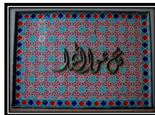
Ornamen Kaligrafi Qulhuallahuahad

Rayhani atau Khat Rayhani dengan Background dari kaligrafi tersebut merupakan keramik mozaik dengan pola geometris. Kaligrafi mengandung nilai akidah.