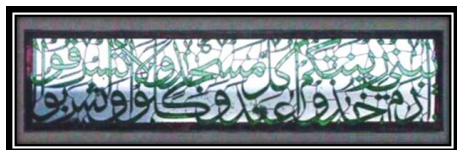
Ornamen Kaligrafi Q.S. Al-A'raaf Ayat 31