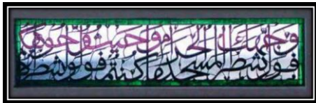
Ornamen Kaligrafi Q. S Al- Baqarah ayat 144