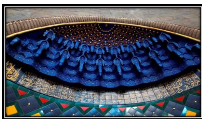
Ornamen Sarang Lebah ( Muqarnas ) dan Kaligrafi

Mihrab Masjid Kampus UGM dihiasi dengan ornamen sarang lebah atau muqarnas yang terinspirasi dari Masjid Syiah di Irak. Pada bagian bawah ornamen muqarnas terdapat kaligrafi Q.S An-Nur ayat 35 menggunakan jenis huruf aliran Tsuluts atau Khat Tuluts yang mengandung nilai akidah. Di bawah tulisan kaligrafi terdapat kombinasi keramik berwarna kuning, hijau dan biru membentuk pola geometris.