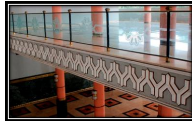
Ornamen Relief Y