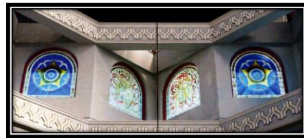
Ornamen Steinglass Lambang UGM dan Ayat Kursi

ornamen bintang segi delapan ( octagonal star shapes ).