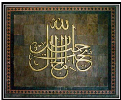
Ornamen Kaligrafi Innallaha Jamiilun Yuhibbul Jamaal

Terletak pada ujung selasar menuju tempat wudhu terdapat kaligrafi bertuliskan " Innallaha jamiilun yuhibbul jamaal ". Ditulis menggunakan aliran Tsuluts atau Khat Tsulut . Mengandung nilai syariah.