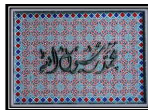
Ornamen Kaligrafi Muhammadarrasulullah