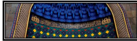
Ornamen Kaligrafi Q.S An-Nur ayat 35 pada Mihrab