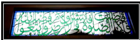
Ornamen Kaligrafi Q.S. Al-Jumu'ah Ayat 10