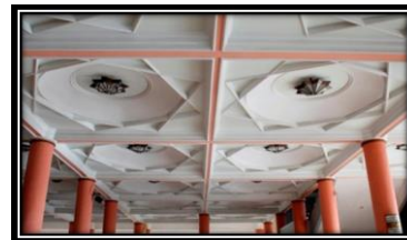
Langit-langit Masjid Kampus UGM