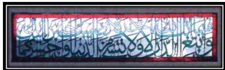
Ornamen Kaligrafi Q.S An-Qashash Ayat 77