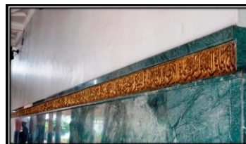
Ornamen kaligrafi Q.S Al- Baqarah ayat 284 pada dinding sebelah kiri Mihrab