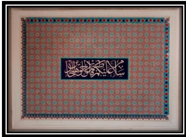
Ornamen Kaligrafi Q.S Az-Zumar ayat 73 Mozaik Dinding Tangga sebelah barat dan timur

berjumlah tujuh buah yang disusun berdampingan diurutkan dari kanan lalu ke kiri seperti tata cara membaca Al-Quran menggunakan jenis huruf aliran Tsuluts atau Khat Tuluts yang disusun bertujuan sebagai sarana menyampaikan pesan nilai nilai akidah dan akhlak.