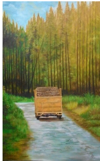
Gambar 14: Tertembang II