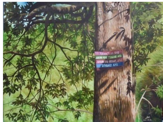
Gambar 9 :Kesuburan Pohon Cat Minyak di atas Kanvas (2014) 140x120 cm

Karya penulis di atas berjudul Kesuburan Pohon . Lukisan ini bercerita tentang pohon yang besar dan gagah, yang sebagian tersinari oleh cahaya matahari, namun sebagiannya lagi tidak, dengan tekstur semu nampak jelas pada kulit-kulit kayu yang membentuk garis