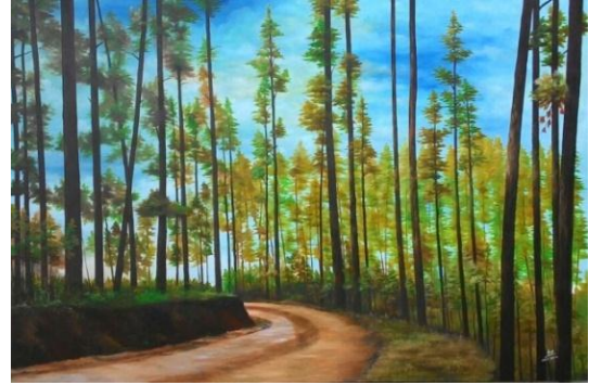
Gambar 12: Tepian Hutan Cat Minyak di atas Kanvas, 2015 Ukuran 160x110 Cm

lukisan ini bercerita tentang pepohonan yang ada ditepian hutan, ditengah tengahnya terdapat jalan yang menikung, dengan latar belakang langit biru, tepian hutan yang sepi terlihat seram, hanya bayangan mereka-mereka yang tak akrab pada dunia luar yang sebenarnya. Tepian hutan yang mencekam dianggap pintu gerbang menuju alam satwa liar yang mengancam manusia. Tepian hutan yang sepertinya teduh, sejujurnya menawarkan kesejukan secara penuh, sejatinya adalah ruangan bagi siapapun yang ingin menjauh dari ibu kota yang semakin hari kian gaduh, tepian hutan pinus. Lurus, kokoh, nan gagah. Sumber energi dunia tak terbantah. Menyimpan tabir misteri juga indahnya, membagi manfaat, juga petakanya. Petaka kala tepian hutan tergusur perlahan kemudian