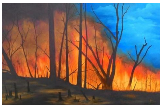
Gambar 10: Terbakar Sudah Cat Minyak di atas Kanvas (2014) 160cm x 140cm

Pada lukisan ini bercerita tentang pepohonan yang terbakar ataupun sengaja dibakar, ketika manusia tidak lagi memikirkan alam sekitar tanpa memperdulikan lingkungannya ketika manusia tidak paham akan pentingnya sebuah pohon yang menjadi point point penting dalam sebuah hutan, pohon yang menjadi cerita atau ikon dari sebuah daerah, kita banya belajar dari pohon tentang bagaimana ia bisa hidup tinggi besar, berbuah dan beranak dengan tunas-tunas mudanya yang kemudian akan kembali tumbuh besar, namun ketika pohon tersebut sudah terbeli ataupun terjarah oleh orang-orang yang tidak bertanggung jawab mereka melakukan apa saja untuk merusaknya guna membuka lahan baru. tidak akan ada lagi kesuburan kesejukan pada alam ini terutama pohon yang selama ini bisa menjadi inspirasi bagi para orang-orang yang telah memperhatikannya, tidak akan ada tempat lagi untuk penghuninya. Harus berlama lama lagi menunggu ia tumbuh besar dan perkasa.