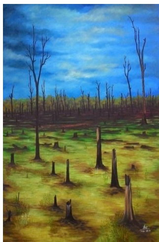
Gambar 16: Sisa Pembakaran Cat Minyak di atas Kanvas, 2014 Ukuran 130Cm x 110 cm

Lukisan ini bertema tentang pepohonan yang sudah hangus terbakar dilahan yang sangat luas seluas mata