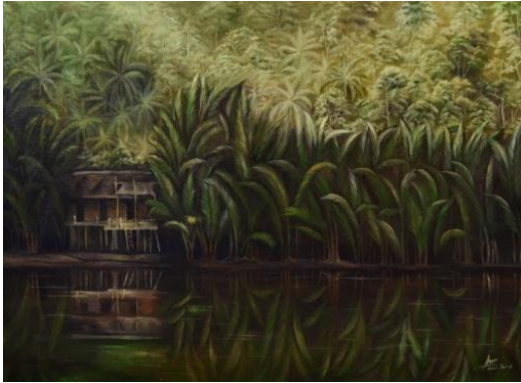
Gambar 17: Barisan Pepohonan Cat Minyak di atas Kanvas, 2014 Ukuran 100x90 cm

Dalam lukisan ini bercerita tentang pedalaman sumatra dengan rimbunya pohon menunjukkan keperawanan rimba tak tersentuh tangan jahil. Sungai mengalir tenang menyimpan sejuta misteri. Ada kehidupan, dan tentu saja buaya. Gubuk sederhana cukuplah sudah menjadi peneduh melawan teriknya mentari dan guyuran hujan. Menambah eksotisme lukisan, pepohonan dikombinasikan dengan cahaya mentari memandikan sunyi. Eksotis memang. Seolah menjadi negasi keangkeran belantara purba.