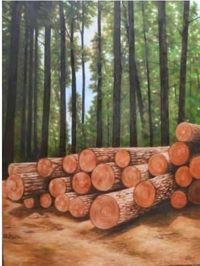
Gambar 13: Tertembang I