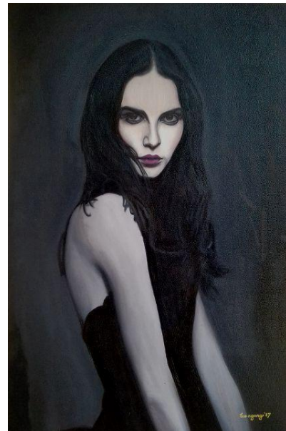
Gambar 40 : Neti Cat Minyak di atas Vinyl 60 m x 85 cm (Juli 2017)

Lukisan di atas menampilkan Potret Model dari seorang wanita yang bernama