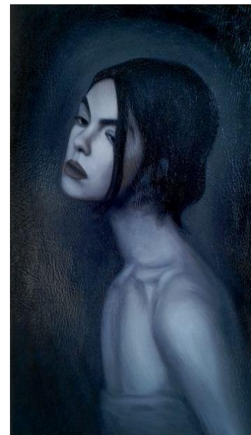
Gambar 42 : Lisa Cat Minyak di atas Vinyl 40 cm x 65 cm (Agustus 2017)