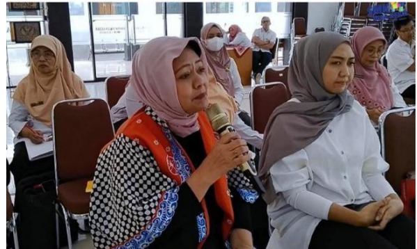
Gambar 1. Kegiatan Review Kurikulum Bersama Mitra Industri Tahun 2024

Dalam dokumentasi tersebut menunjukkan kegiatan review kurikulum bersama mitra industri yang dilakukan rutin setiap tahun. Kegiatan termasuk dalam aspek komunikasi karena menjadi sarana penyampaian informasi, penyalarsan kebutuhan kompetensi, serta koordinasi antara pihak sekolah dengan mitra dunia usaha dan dunia industri dalam rangka memastikan bahwa kurikulum yang diterapkan sesuai dengan kebutuhan industri.