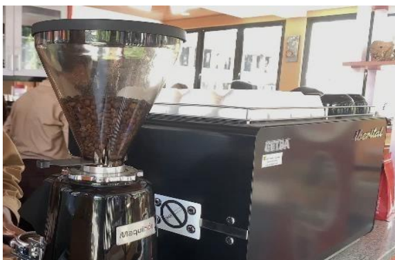
Gambar 2. Fasilitas Mesin Kopi di Teaching factory

Dukungan pendanaan program juga menjadi faktor penting dalam pelaksanaan kegiatan pengembangan kompetensi siswa dan guru. Pendanaan