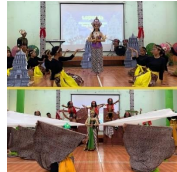
Gambar 4. Siswa yang Terlibat Aktif dalam Membangun Budaya Sekolah yang Inklusif dan Partisipatif

antara guru, staf, dan siswa dalam menciptakan lingkungan sekolah yang benar-benar ramah dan inklusif.