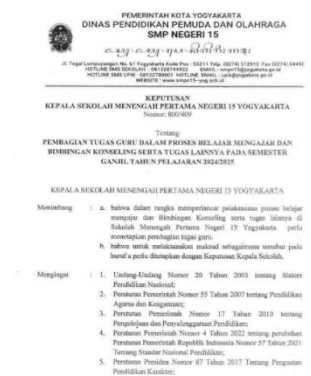
Gambar 5. Kebijakan Sekolah Mendukung Perlindungan dan Partisipasi Siswa dalam Program SRA

tidak hanya menjalankan fungsi mengajar, tetapi menjadi fasilitator dan pendukung terciptanya lingkungan sekolah yang aman, nyaman, dan inklusif. Poin tersebut seperti halnya dijelaskan dalam buku pedoman oleh ((KPPPA), 2022) keberhasilan sekolah ramah anak menuntut sinergi antara kebijakan sekolah, kompetensi guru, dan partisipasi anak dalam setiap aspek kehidupan sekolah.