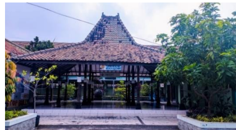
Gambar 3. Fasilitas SRA Wujudkan Sekolah Aman, Nyaman, dan Inklusif

BOS dan BOSDA, yang digunakan untuk kegiatan pelatihan guru, pengadaan sarana, dan berbagai kegiatan siswa. Sekolah juga terbuka terhadap dukungan sponsor dari pihak luar. Meskipun siswa belum mengetahui secara rinci tentang sistem pendanaan, mereka menyadari pentingnya keberadaan dana dalam mendukung keberlangsungan kegiatan ramah anak di sekolah.