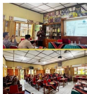
Gambar 2. Penyampaian Informasi Program SRA oleh Kepala Sekolah kepada Guru dan Siswa dengan Media Visual

lingkungan sekolah. Penggunaan media digital ini dianggap cukup efektif menjangkau siswa, namun demikian, konten yang disampaikan masih bersifat umum dan belum maksimal dalam memberikan pemahaman mendalam. Oleh karena itu, intensitas dan kualitas komunikasi perlu ditingkatkan agar seluruh warga sekolah, terutama siswa, benar-benar memahami nilai dan tujuan program SRA secara merata.