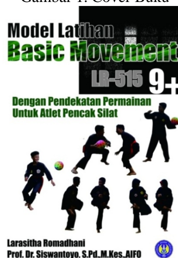
Gambar 1. Cover Buku

Spesifikasi produk media buku Model Latihan Basic Movement LR-515 9+ dengan Pendekatan Permainan ini adalah sebagai berikut ukuran dari buku tersebut adalah 14 cm x 20 cm dengan warna dasar putih. Bahan yang digunakan dalam cover menggunakan kertas ivory 230 gr disertai lapisan laminasi dan isi buku menggunakan kertas HVS 80 gr.