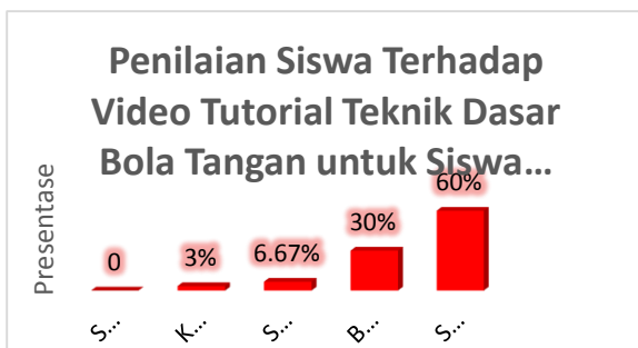
Gambar 1. Diagram Batang Penilaian Siswa Terhadap Video Tutorial Teknik Dasar Bola Tangan untuk Siswa SMAN 1 Imogiri

Berdasarkan distribusi frekuensi pada tabel diatas, penilaian siswa terhadap video tutorial teknik dasar bola tangan siswa SMAN 1 Imogiri dapat disajikan pada gambar 1 berikut :