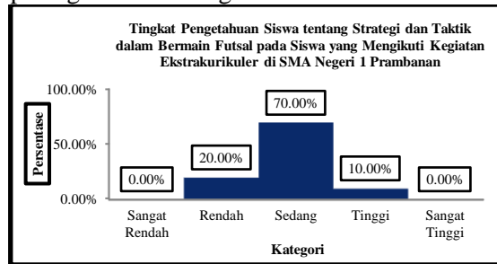
Gambar 1. Diagram Batang Tingkat Pengetahuan Siswa tentang Strategi dan Taktik dalam Bermain Futsal pada Siswa yang Mengikuti Kegiatan Ekstrakurikuler di SMA Negeri 1 Prambanan

siswa yang mengikuti kegiatan ekstrakurikuler di SMA Negeri 1 Prambanan dapat disajikan pada gambar 1 sebagai berikut: