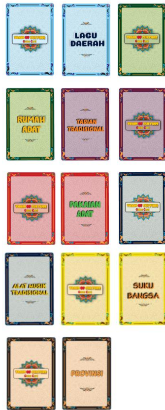
Gambar 2. Kartu Budaya

kartu suku bangsa, kartu tarian tradisional, kartu rumah adat, kartu alat musik tradisional, kartu lagu daerah dan kartu pakaian adat.