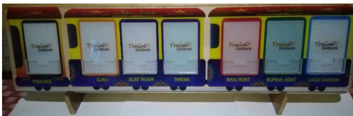
Gambar 1. Papan kereta budaya

Papan media pembelajaran kereta budaya ( train of culture ) terbuat dari papan akrilik dengan tebal 3 mm berbentuk persegi panjang dengan panjang 20 cm dan lebar 80 cm. Papan diprint dengan desain gambar kereta api untuk memasang kartu-kartu budaya.