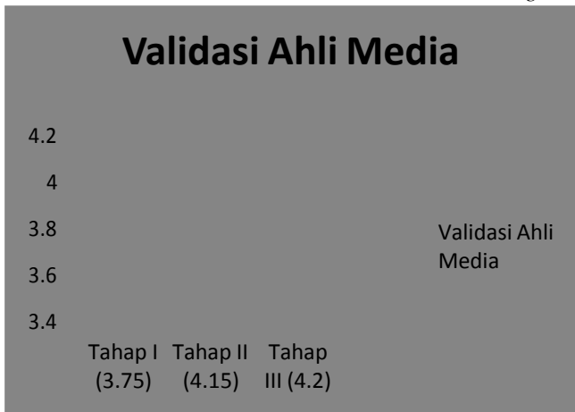
Gambar 2 Diagram Batang Penilaian Ahli Media Tahap Pertama hingga Tahap Ketiga