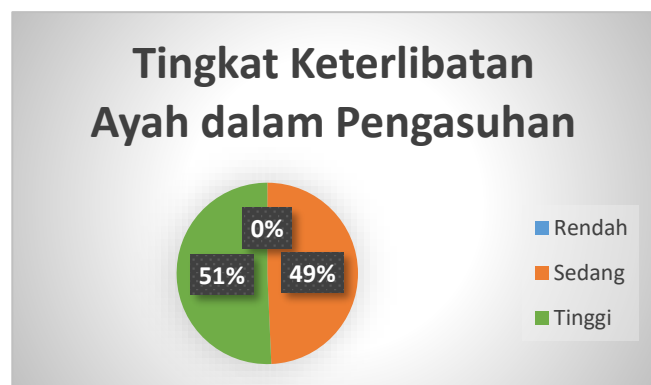
Gambar 1. Diagram Tingkat Keterlibatan Ayah dalam Pengasuhan

Hasil dari pengambilan data melalui angket tingkat harga diri anak menunjukkan bahwa nilai rata-rata tingkat harga diri anak yang dijadikan sampel sebesar 47,5. Nilai yang paling sering muncul adalah 60. Sedangkan nilai tengah yang didapat adalah 64.