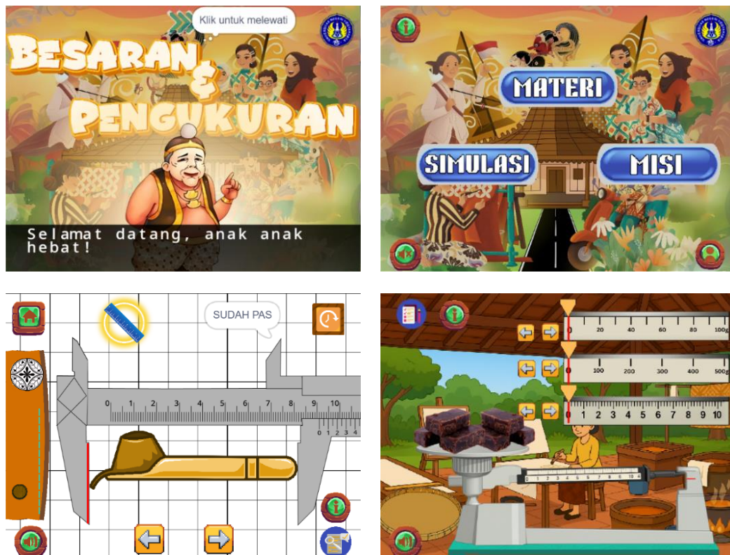
Gambar 3. Hasil Rancangan Media Scratch

Media Scratch yang dikembangkan terdiri atas 3 menu utama, yaitu menu materi, simulasi pengukuran panjang menggunakan mistar dan jangka sorong, serta dua misi pembelajaran. Misi pertama berupa kegiatan drag and drop besaran, satuan SI, dan dimensi yang dikaitkan dengan proses pembuatan batik kawung. Misi kedua mengajak siswa melakukan simulasi sederhana pembuatan batik kawung dari awal hingga akhir, yang melibatkan pengukuran luas, massa, suhu beserta konversinya, volume, dan waktu. Kegiatan ini terintegrasi dalam modul ajar dan LKPD. Dengan demikian, Scratch memiliki keunggulan dalam memberikan pengalaman belajar yang konkret dan bermakna, meningkatkan keaktifan siswa, serta melatih kemampuan pemecahan masalah.