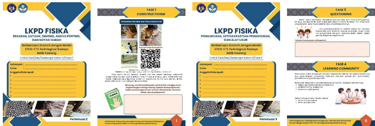
Gambar 2. Hasil Rancangan LKPD

Media Scratch yang dikembangkan terdiri atas 3 menu utama, yaitu menu materi, simulasi pengukuran panjang menggunakan mistar dan jangka sorong, serta dua misi pembelajaran. Misi pertama berupa kegiatan drag and drop besaran, satuan SI, dan dimensi yang dikaitkan dengan proses pembuatan batik kawung. Misi kedua mengajak siswa melakukan simulasi sederhana pembuatan batik kawung dari awal hingga akhir, yang melibatkan pengukuran luas, massa, suhu beserta konversinya, volume, dan waktu. Kegiatan ini terintegrasi dalam modul ajar dan LKPD. Dengan demikian, Scratch memiliki keunggulan dalam memberikan pengalaman belajar yang konkret dan bermakna, meningkatkan keaktifan siswa, serta melatih kemampuan pemecahan masalah.