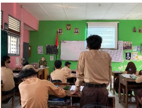
Gambar 1. Pembelajaran Menyimak

Hasil penelitian mengenai pemanfaatan media dalam pembelajaran menyimak