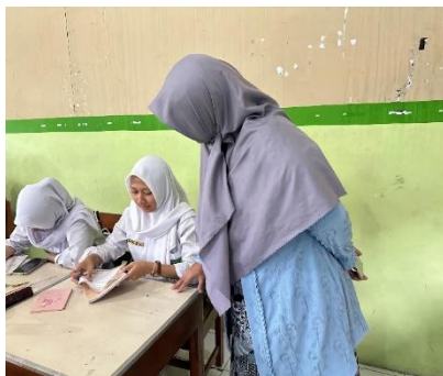
Gambar 3. Kegiatan Menulis Puisi Siklus II

pembelajaran menulis puisi berwawasan interkulturalisme berbantuan video suasana yang telah diimplementasikan dalam dua siklus memberikan progres positif terhadap kualitas proses pembelajaran.