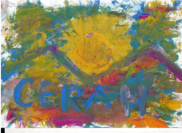
Gambar 14. Tema Karya “Masa Depan Cerah” Karya idho, ukuran: 21X30 cm (A4) media cat air

Setiap objek dalam lukisan karya Ridho teridentifikasi dengan baik. Bentuk yang dimunculkan merupakan hasil imajinasi dengan melihat bentuk aslinya. Kelancaran goresan terkontrol dan jelas. Gaya lukisan termasuk gaya haptic . Warna teridentifikasi dengan baik. Warna yang digunakan merupakan imajinasi. Warna sebagai ekspresi diri.