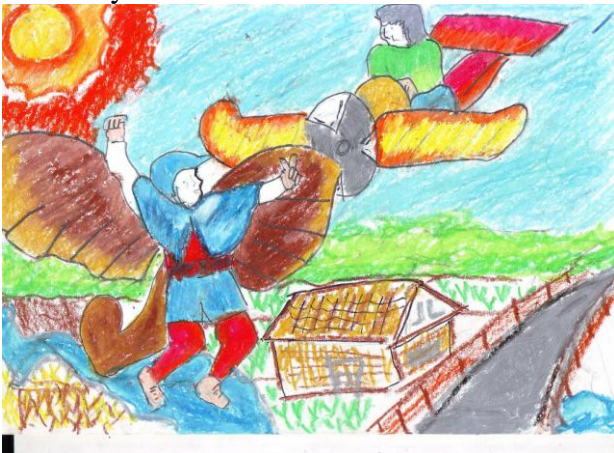
Gambar 15. Tema Karya “Super Hero” Karya Ridwan, ukuran: 21X30 cm (A4) media crayon

Setiap objek dalam lukisan karya Ridwan teridentifikasi dengan baik. Bentuk yang