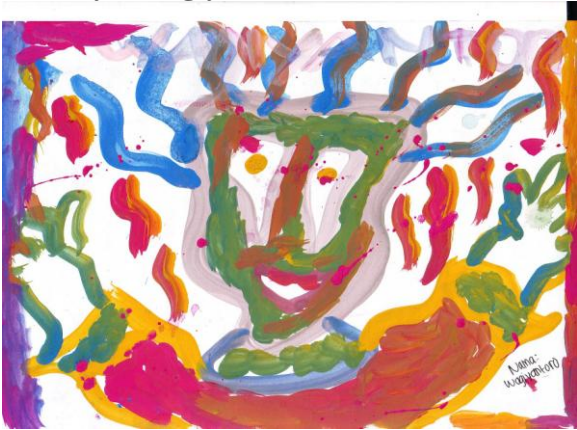
Gambar 1. Tema Karya “Badut” Karya Wagiyanto, ukuran: 21X30 cm (A4) media cat air

Setiap objek dalam lukisan karya Wagiyanto teridentifikasi dengan baik. Bentuk yang dimunculkan merupakan hasil imajinasi sesuai dengan ingatan anak. Goresan dalam membuat bentuk terlihat ekspresif. Tipe lukisan termasuk tipe haptic . Warna teridentifikasi dengan baik. Warna yang digunakan sesuai dengan imajinasi anak. Warna sebagai ekspresi diri sendiri.