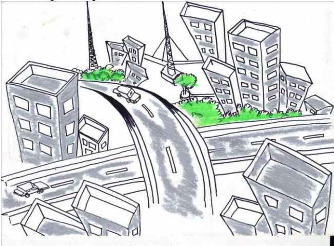
Gambar 4. Tema Karya “Masa Depan” Karya Saryadi, ukuran: 21X30 cm (A4) media crayon

Setiap objek dalam lukisan karya Saryadi teridentifikasi dengan baik. Bentuk yang dimunculkan merupakan hasil tiruan dari bentuk aslinya. Kelancran goresan terkontrol dan jelas. Gaya lukisan termasuk gaya willing type . Warna teridentifikasi dengan baik. Warna yang digunakan merupakan imajinasi tetapi melihat dari warna aslinya. Warna sebagai penguat objek.