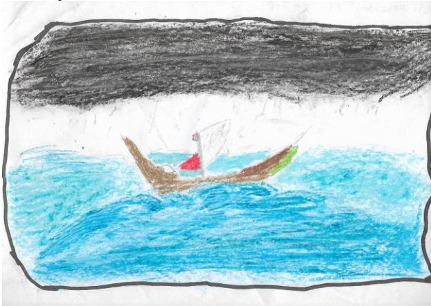
Gambar 11. Tema Karya “Perahu” Karya Alfi, ukuran: 21X30 cm (A4) media crayon

Setiap objek dalam lukisan karya Alfi teridentifikasi dengan baik. Bentuk yang dimunculkan merupakan hasil imajinasi dengan melihat bentuk aslinya. Kelancaran goresan terkontrol dan jelas. Gaya lukisan termasuk gaya non haptic . Warna teridentifikasi dengan baik. Warna yang digunakan merupakan imajinasi. Warna sebagai penguat bentuk.