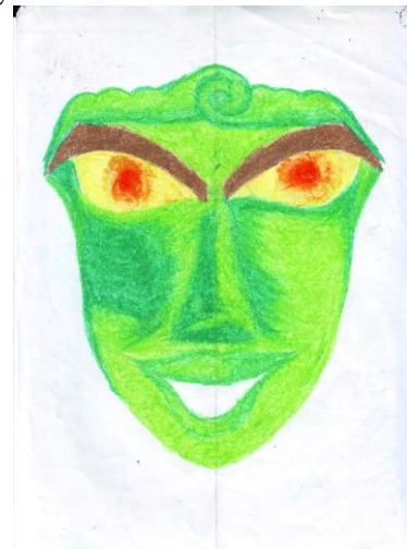
Gambar 3. Tema Karya “Wajah” Karya Dion, ukuran: 21X30 cm (A4) media crayon