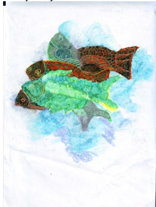
Gambar 10. Tema Karya “Hello Myname is Sapi” Karya Paryanto, ukuran: 21X30 cm (A4) media crayon

Setiap objek dalam lukisan karya Paryanto teridentifikasi dengan baik. Bentuk yang dimunculkan merupakan hasil imajinasi dengan melihat bentuk aslinya. Kelancaran goresan terkontrol dan jelas. Gaya lukisan termasuk gaya non haptic . Warna teridentifikasi dengan baik. Warna yang digunakan merupakan imajinasi. Warna sebagai pengisi bentuk.