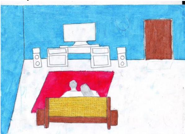
Gambar 7. Tema Karya “Bersama Pacar” Karya Yanto, ukuran: 21X30 cm (A4) media crayon

Setiap objek dalam lukisan karya Yanto teridentifikasi dengan baik. Bentuk yang dimunculkan merupakan hasil imajinasi dengan melihat bentuk aslinya. Kelancaran goresan terkontrol dan jelas. Gaya lukisan termasuk gaya non haptic . Warna teridentifikasi dengan baik. Warna yang digunakan merupakan imajinasi. Warna sebagai pengisi bentuk