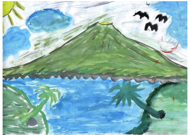
Gambar 2. Tema Karya “Pemandangan” Karya Denni, ukuran: 21X30 cm (A4) media cat air

Setiap objek dalam lukisan karya Denni teridentifikasi dengan baik. Bentuk yang dimunculkan merupakan hasil tiruan dari bentuk aslinya. Kelancaran goresan terkontrol dan jelas. Gaya lukisan termasuk gaya naturalistik. Warna teridentifikasi dengan baik. Warna yang digunakan menyerupai warna aslinya. Warna sebagai penguat objek.