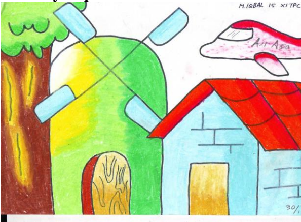
Gambar 6. Tema Karya “Pemandangan” Karya Iqbal, ukuran: 21X30 cm (A4) media crayon

Setiap objek dalam lukisan karya Iqbal teridentifikasi dengan baik. Bentuk yang dimunculkan merupakan hasil imajinasi dengan melihat bentuk aslinya. Kelancaran goresan terkontrol dan jelas. Gaya lukisan termasuk gaya non haptic . Warna teridentifikasi dengan baik. Warna yang digunakan merupakan imajinasi. Warna sebagai penguat objek.