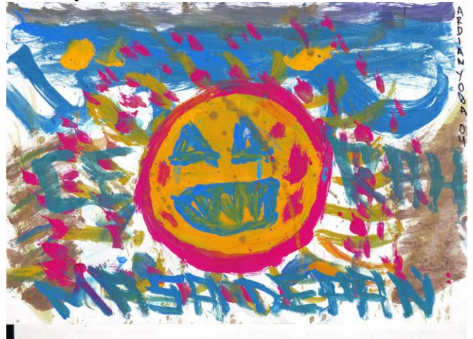
Gambar 13. Tema Karya “Masa Depan” Karya Ardian, ukuran: 21X30 cm (A4) media cat air

Setiap objek dalam lukisan karya Ardian teridentifikasi dengan baik. Bentuk yang dimunculkan merupakan hasil imajinasi dengan melihat bentuk aslinya. Kelancaran goresan terkontrol dan jelas. Gaya lukisan termasuk gaya haptic . Warna teridentifikasi dengan baik. Warna yang digunakan merupakan imajinasi. Warna sebagai ekspresi diri.