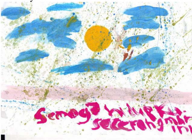
Gambar 12. Tema Karya “Harapan” Karya Rosid, ukuran: 21X30 cm (A4) media cat air

Setiap objek dalam lukisan karya Rosid teridentifikasi dengan baik. Bentuk yang