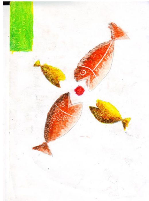
Gambar 16. Tema Karya “Keluarga Ikan” Karya Tito, ukuran: 21X30 cm (A4) media crayon

Setiap objek dalam lukisan karya Tito teridentifikasi dengan baik. Bentuk yang dimunculkan merupakan hasil imajinasi dengan melihat bentuk aslinya. Kelancaran goresan terkontrol dan jelas. Gaya lukisan termasuk gaya non haptic . Warna teridentifikasi dengan baik. Warna yang digunakan merupakan imajinasi. Warna sebagai pengisi bentuk.