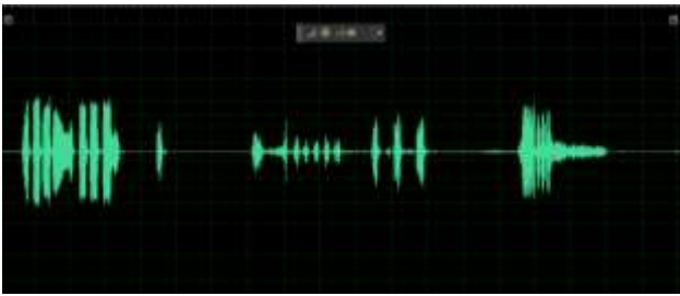
Gambar 2. Sampel sinyal suara burung Anis Merah

sehingga suara-suara tersebut dipotong dan menghasilkan suara kicauan burung 1 periodik.