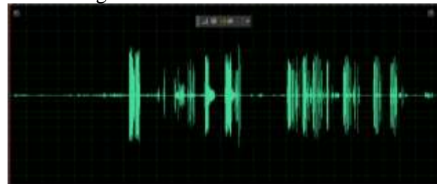
Gambar 1. Suara hasil rekaman penuh burung Anis Merah

Dalam proses perekaman, suara di rekam berulang kali menggunakan voice recorder digital dan mic ditempatkan pada jarak terdekat dengan sumber suara untuk mendapatkan suara binatang sedikit noise . Kemudian suara kicauan dipisahkan dari sumber suara yang lain untuk dilakukan analisis spektrum warna suara yang terkandung.