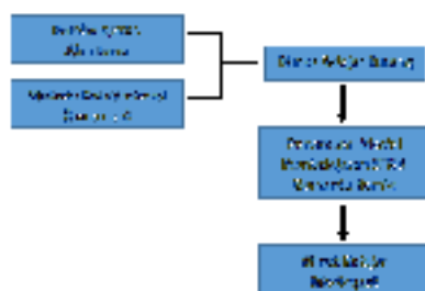
Gambar 1. Kerangka Berpikir

Oleh karena itu diperlukan perubahan proses pembelajaran untuk lebih meningkatkan minat belajar siswa dan mengurangi keengganan siswa dalam belajar akuntansi. Pembelajaran akuntansi dapat dilakukan dengan menggunakan model pembelajaran kooperatif tipe STAD ( Student Teams Achievement Devisions ) berbantu media komik. Proses ini akan lebih menyenangkan dan menarik perhatian siswa untuk berpartisipasi dalam proses pembelajaran, dapat saling mengajari pasangan kelompok untuk menyelesaikan permasalahan yang dihadapi. Hingga pada akhirnya hal tersebut dapat meningkatkan minat belajar akuntansi siswa khususnya dalam bidang akuntansi. Berdasarkan uraian tersebut, maka model dalam penelitian tindakan kelas ini dapat digambarkan sebagai berikut: