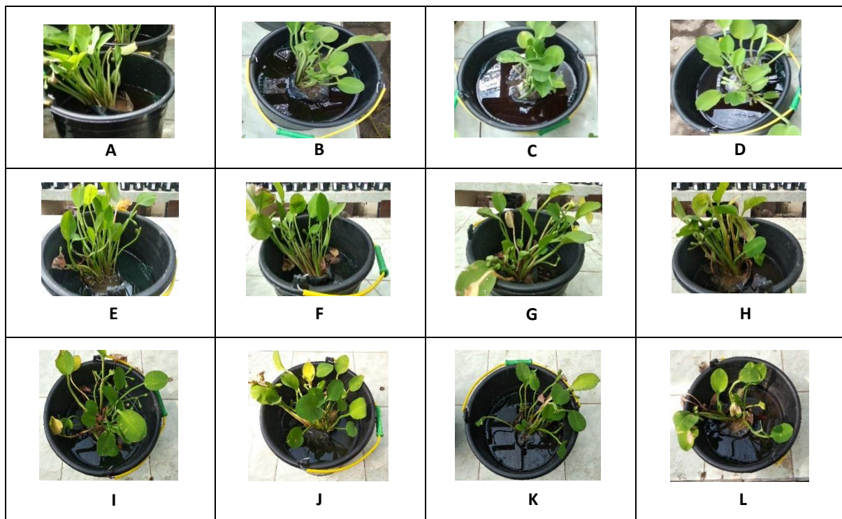
Gambar 2. Performa Tanaman Genjer setelah Perlakuan Fitoremediasi 0%, 75%, 50%, dan 25% pada Hari Ke-0, Hari Ke-7, dan Hari Ke-14. (Keterangan: Pada hari ke-0, daun dan batang tanaman berwarna hijau segar, terdapat pertumbuhan bunga, dan muncul tunas 5, 4, 4, dan 3 berturut-turut pada masing-masing perlakuan (Gambar A-D); pada hari ke-7, daun dan batang dominan berwarna hijau, beberapa ada yang mati dan melayang pada permukaan air, muncul bercak kuning kehitaman, terdapat

Adapun performa tanaman genjer yang teramati setelah perlakuan fitoremediasi pada hari ke-0, ke-7 dan ke-14 dapat dilihat pada Gambar 2.