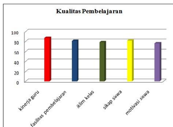
Gambar 1. Diagram Kualitas Pembelajaran IPS di Kabupaten Sumbawa

Sub-komponen yang masih rendah dalam kualitas pembelajaran IPS di Kabupaten Sumbawa adalah pada sub-komponen motivasi siswa dengan rata-rata skor 3,81 dan sub-komponen tertinggi untuk kualitas pembelajaran IPS terdapat pada sub-indikator kinerja guru dalam pembelajaran IPS sebesar 4,34 sehingga semua komponen berada pada kriteria baik.