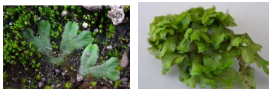
(a) (b) Gambar 1. Kelas Marchantiopsida : Riccia sp. dan Cyathodium smaragdinum

Karakteristik Riccia sp. dari kelas Marchantiopsida yaitu memiliki rhizoid tipis, talus tebal, berwarna hijau gelap, terdapat midrib, dan bertepi rata. Panjang 7-8 mm, lebar 4-5 mm dan ditemukan tumbuh di taman depan halaman sekolah. Sedangkan Cyathodium smaragdinum memiliki ciri rhizoid tipis, talus tipis, berwarna hijau cerah, permukaan talus terdapat pori-pori berupa titik kecil, panjang 5-6 mm, lebar 3-4 mm, ditemukan di dinding selokan tempat parkir.