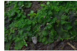
Gambar 2. kelas Anthocerotopsida: Notothylas javanicus

9-10 mm, lebar 4 mm, ditemukan di taman depan dan taman belakang sekolah.