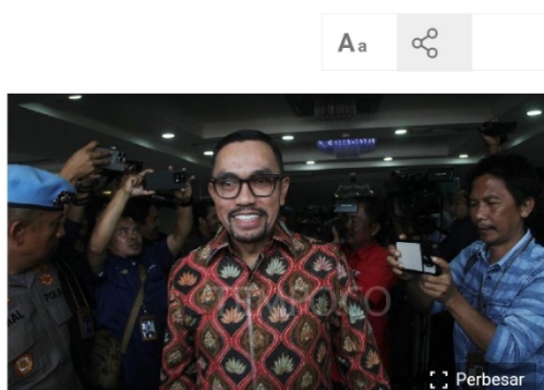
Wakil Ketua Komisi Ahmad Sahroni (tengah) dalam Kunjungan Komisi III DPR RI ke Mapolda Sumatera Barat, 25 November 2024.