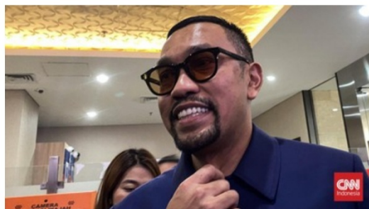
Sahroni respons kritik rakyat untuk bubarkan DPR RI.