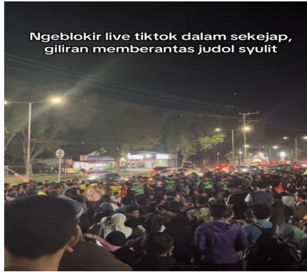
Gambar 3.3. Konten TikTok @zulkflyr

sepihak, sementara frasa “syulit” (sulit) mengandung ironi yang membandingkan ketegasan platform dalam menonaktifkan fitur Live dengan lemahnya penanganan isu lain.