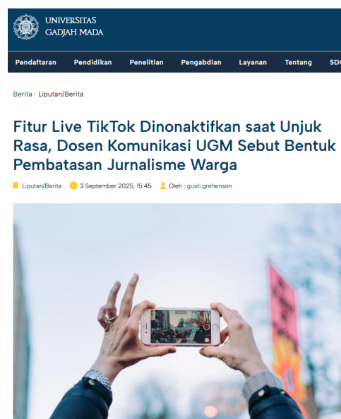
Gambar 3.1. Laman berita UGM

Artikel berita UGM secara konsisten merepresentasikan penangguhan fitur Live TikTok sebagai tindakan yang berdampak pada pembatasan jurnalisme warga. Hal ini terlihat dari penggunaan diksi seperti “dinonaktifkan” dan “pembatasan”, yang mengonstruksi relasi kuasa asimetris antara platform digital dan warga. Istilah “jurnalisme warga” digunakan sebagai penanda utama untuk menekankan fungsi fitur Live sebagai sarana dokumentasi, pengawasan publik, dan penyebaran informasi secara real-time dalam konteks demonstrasi.