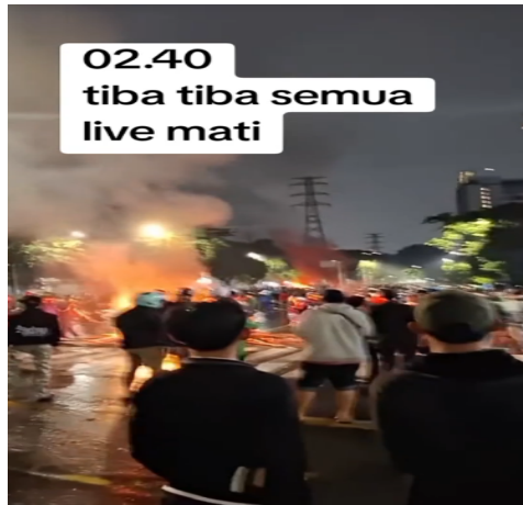
Gambar 3.5. Konten TikTok @sinetron.Indonesia