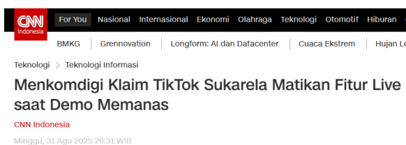
Gambar 3.2 Laman berita CNN

Berbeda dengan artikel UGM, artikel CNN Indonesia berjudul “Menkomdigi Klaim TikTok Sukarela Matikan Fitur Live saat Demo Memanas” menghadirkan framing yang lebih netral dan cenderung defensif terhadap platform. Pilihan kata “klaim” dan “sukarela” berfungsi untuk mengurangi kesan koersif dari tindakan TikTok, serta mengalihkan fokus dari isu pembatasan kebebasan berekspresi ke aspek keamanan dan stabilitas. Dalam wacana ini, penonaktifan fitur Live diposisikan sebagai respons preventif terhadap situasi demonstrasi yang “memanas”, bukan sebagai bentuk kontrol struktural atas partisipasi publik.