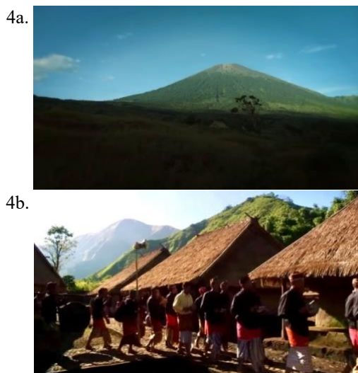
Gambar 4. Adegan Non-dialog dengan musik tradisional Sasak (4a. pembukaan Gunung Rinjani, soundscape alam; 4b. iringan gendang beleq murni tanpa dialog)

Dari total 126 adegan, terdapat 17 adegan (13,5 %) tanpa dialog verbal yang hanya diisi musik tradisional Sasak, gendang beleq, atau soundscape alam. Adegan-adegan ini berfungsi sebagai penanda simbolik transisi nilai dari harmoni adat menuju disrupsi, berduka hingga akhirnya terjadi restorasi ritual.