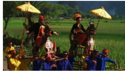
Gambar 5. Klimaks Restorasi Identitas dalam Prosesi Beponggoan dan Nyongkolan

Gambar 4 menunjukkan bahwa sutradara sengaja menggunakan elemen sonik non-verbal sebagai narator tak kasat mata yang menandai transisi nilai dari harmoni adat menuju restorasi ritual. Beberapa adegan ditampilkan tanpa dialog, hanya iringan musik instrumen, suara alam, atau music tradisional.