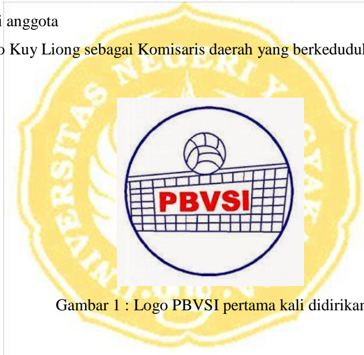
Gambar 1 : Logo PBVSI pertama kali didirikan

Pada bulan Maret 1955, PBVSI disahkan oleh KOI sebagai induk organisasi bola voli tertinggi di Indonesia. Pada tahun yang sama itu pula, PBVSI mendapat pengesahan sementara dari IVBF (International Volleyball Federation) yang merupakan induk organisasi bola voli dunia yang bermarkas besar di Paris, Perancis. Bulan Oktober 1959, PBVSI resmi menjadi anggota IVBF atau sekarang yang dikenal dengan sebutan FIVB. Pada saat itu ada 64 Negara anggota FIVB/ IVBF, dan PBVSI menjadi anggota yang ke 62. PBVSI sejak itu aktif mengembangkan kegiatan-kegiatan baik di dalam maupun ke luar negeri. Perkembangan permainan bola voli sangat