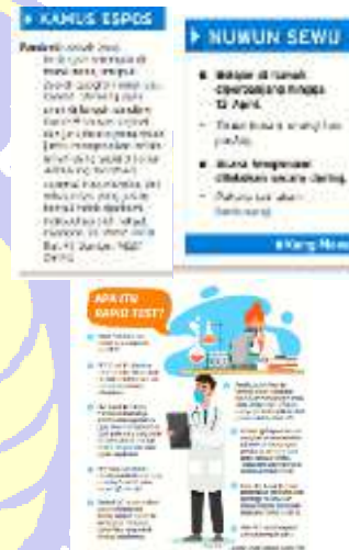
Gambar 1. Harian Solopos menyajikan fungsi informasi pada rubrik Espospedia, kamus espos

Berdasarkan hasil coding, Harian Solopos menerapkan fungsi memberi informasi terkait covid-19 dengan menyajikan rubrik 'Espospedia' yang berisikan himbauan, cara peningkatan imunitas, ataupun edukasi terkait covid-19. Menyajikan rubrik 'kamus espos' dan 'Nuwun sewu' pada setiap halaman rubrik, yang dilansirkan dengan sumber yang jelas. Hasil temuan ini relevan dengan penelitian yang dilakukan Syahputro (2020) media cetak memberikan informasi tentang covid-19.