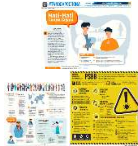
Gambar 3 Hariain Solopos menerapkan fungsi persuasif tentang covid-19 pada rubrik #TanggapCorona.

Salah satu Fungsi media yaitu mempersuasif pembaca melalui sajian berita yang disampaikan. Hariain Solopos mempraktikkan fungsi persuasif kepada masyarakat mengenai informasi covid-19 dengan membentuk pandangan-pandangan terkait pencegahan covid-19. Berdasarkan koding, edisi 23Maret-27 April 2020 Hariain Solopos menampilkan informasi covid-19 dalam bentuk berbagai sajian dalam berbagai sudut pandang. Temuan penelitian ini selaras dengan penelitian Romli (2020) masyarakat mengetahui informasi tentang covid-19, social distancing bersumber dari media massa dan media sosial. Fungsi persuasif Hariain Solopos sebagaimana pada edisi 8 April 2020 sebagai berikut :