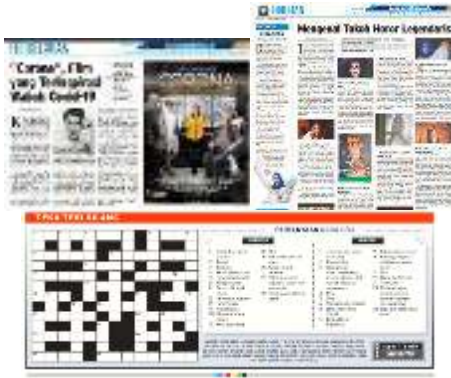
Gambar 4 Harian Solopos menyajikan fungsi menghibur pada rubrik Hiburan.

Dengan demikian, Harian Solopos sebagai sebuah media massa cetak bersifat lokal daerah menjalankan operasional kerja jurnalistik dengan berlandaskan sebagaimana fungsi media massa untuk menyebarkan informasi kepada khalayak. Hal ini membuktikan sebagai koran lokal, Harian Solopos memberikan informasi, mendidik, mengajak, menghibur pembaca pada edisi 23Maret-27April 2020 terkait informasi covid-19.