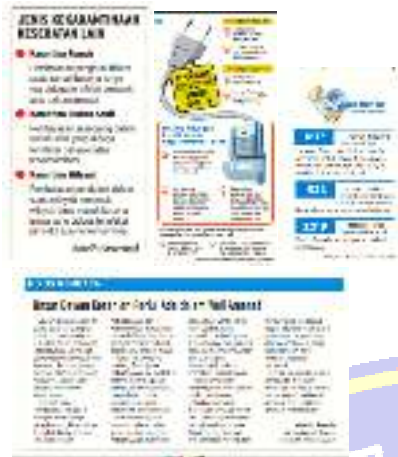
Gambar 2 Hariain Solopos menerapkan fungsi mendidik pada rubrik #TanggapCorona.

2011) media massa bertanggung jawab memberikan edukasi kepada pembaca. Sebagaimana pada edisi 2 April 2020 sebagai berikut: