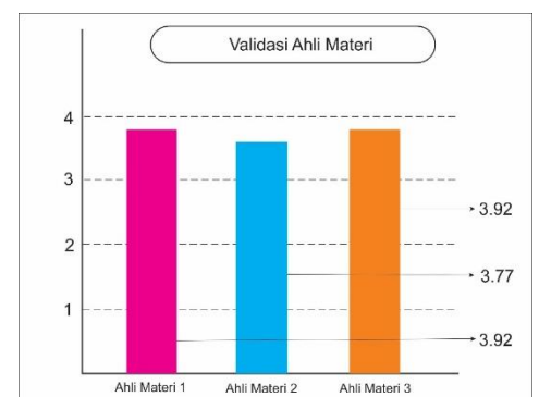
Gambar 1. Hasil validasi Materi

Setelah produk disusun maka tahap selanjutnya yaitu validasi media buku Pop-up Kisah Teladan Walisongo. Peneliti melakukan validasi kepada ahli materi dan ahli media. Data yang diperoleh dari proses validasi adalah data kuantitatif dan kualitatif. Data kuantitatif diperoleh dari hasil penilaian angket kelayakan media yang menggunakan skala likert dengan interval 1-4. Sedangkan data kualitatif diperoleh dari pengisian saran dan masukkan validator yang terdapat pada angket.