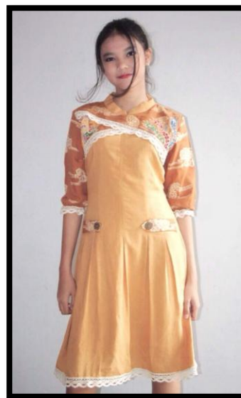
Gambar 8: Busana Batik “Phoenix dan Awan”

Busana ini memiliki motif yaitu motif burung Phoenix dan motif mega mendung. Motif badan burung Phoenix diletakkan di bagian depan sebelah kanan dengan sambungan ekor yang terletak di bagian dada sebelah kiri. Dengan arah yang berhadapan. Kemudian motif awan atau mega mendung terletak di kedua lengan dan depan dekat dengan motif Phoenix. Busana ini berwarna cokelat disini melambangkan bumi, kedamaian, produktivitas, praktis, dan kerja keras.