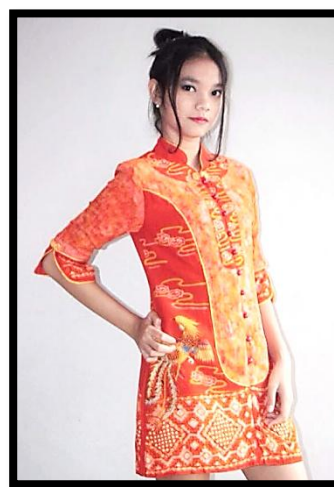
Gambar 2: Busana Batik “ The Power Of Phoenix ” (Dokumentasi Sandra Dian Pawestri, 2017)

Dari warna orange tersebut melambangkan kehangatan,daya tahan danketertarikan, warna kuning dan coklat melambangkan kegembiraan dan kehangatan.