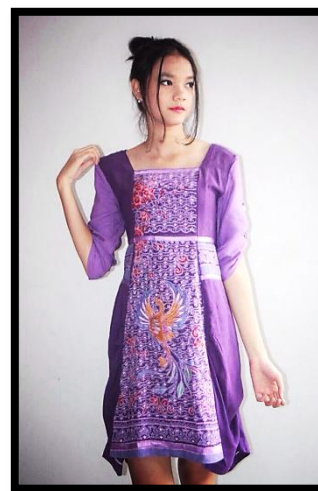
Gambar:Busana Batik “ The Power of Phoenix ”

yang berarti kekuatan yang berasal dari Phoenix. Busana ini berukuran all size wanita. Media yang digunakan adalah kain mori santung, sedangkan pewarnannya menggunakan rapid dan indigosol sebagai coletan dan pencelupan.