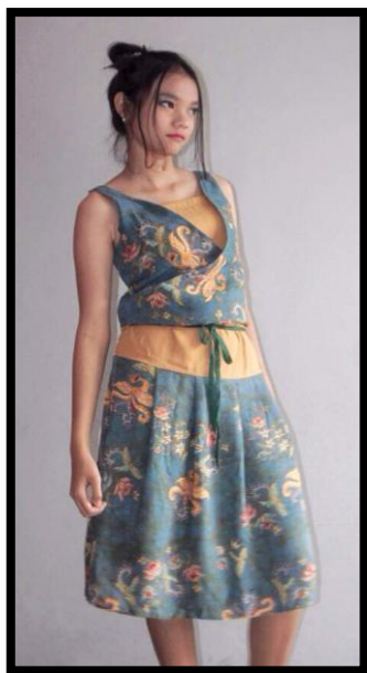
Gambar 7: Busana Batik “Phoenix and Flowers”

warnanya. Busana tersebut memperlihatkan pemakainya terkesan modis dan elegant .