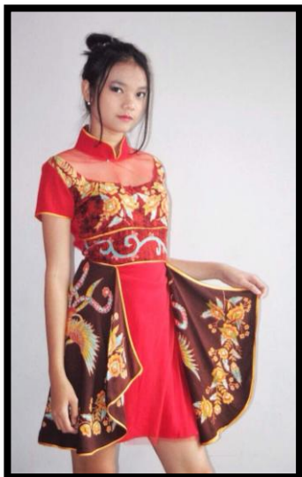
Gambar 6: Busana Batik “Queen Phoenix”

Busana ini memiliki beberapa motif yaitu motif burung Phoenix, motif pagersari dan motif bunga angrak. Motif burung Phoenix berada pada bagian rok dan saling berhadapan. Motif pagersari berada pada bagian perut. Motif bunga angrek berada pada ujung bawah rok dan pada bagian dada.