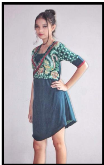
Gambar 3: Busana Batik “Phoenix Gupala”

Phoenix si penjaga jiwa. Busana ini berukuran all size wanita. Media yang digunakan adalah kain mori santung, sedangkan pewarnannya menggunakan rapid, naptol, dan indigosol sebagai coletan dan pencelupan.