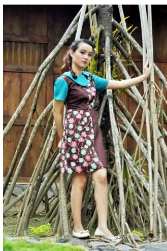
Gambar 11. Dress Silange Batik Lumpure Teratai