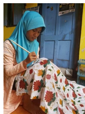
Gambar 5. Penembokan malam batik

Proses penembokan adalah menutup motif bagian tertentu pada kain dengan menggunakan canting tembok atau kuas.