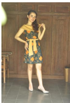
Gambar 9. Dress Sabrina Batik Purnamane Teratai