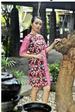
Gambar 14. Dress Iris Batik Kumpule Teratai