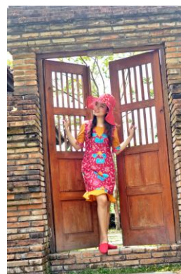
Gambar 12. Dress Gelombang Batik Kumpule Teratai