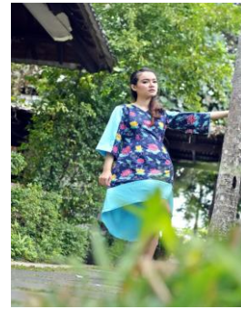
Gambar 15. Dress Ayun Batik Taburan Teratai