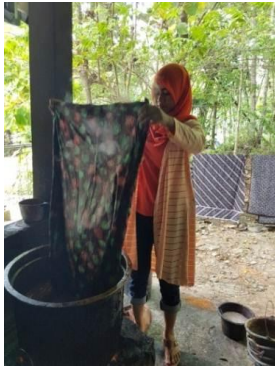
Gambar 6. Melorod

Melorod adalah tahapan menghilangkan malam pada kain yang sudah selesai diwarnai dengan menggunakan waterglas yang sudah mendidih dengan campuran air.