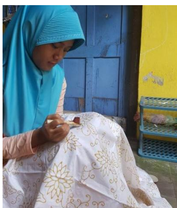
Gambar 2. Membatik

Proses pencantingan merupakan menggambar diatas kain yang sudah dipola menggunakan canting klowong, cecek,dan tembok.