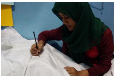
Gambar 1. Memola

Memola merupakan memindahkan pola terpilih pada kain yang sudah di tentukandengan media menggunakan pensil dan kaca yang dibawahnya diberi cahaa lampu untuk menerawang gambar motif yang akan di pindahkan pada pola.