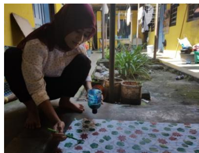
Gambar 3. Pengolesan Remasol

sudah selesai dibatik dengan menggunakan pewarna sintesis remasol.