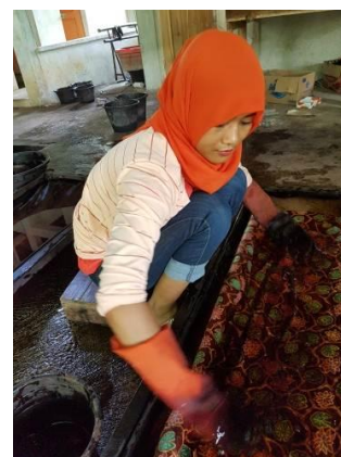
Gambar 4. Pencelupan naphthol

Pewarnaan merupakan proses pencelupan kain yang sudah selesai dibatik dengan menggunakan pewarna sintesis remasol.