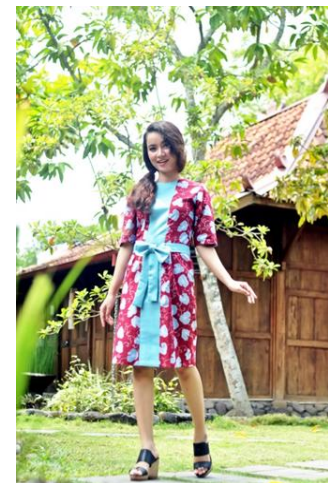
Gambar 8. Dress Luruse Batik Marunan Teratai