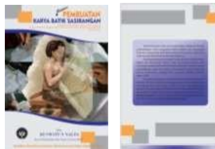
Gambar 5. Hasil Produk Akhir Modul Pembuatan Batik Sasirangan.

membuat Batik Sasirangan disertai penjelasannya, gambar proses pembuatan Batik Sasirangan hingga selesai.