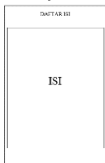
Gambar 4. Rancangan Penutup Dan Daftar Isi