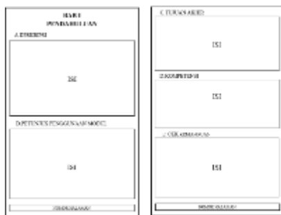
Gambar 2. Rancangan Pendahuluan