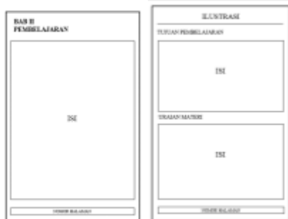
Gambar. Rancangan Kegiatan Pembelajaran 1,2,3