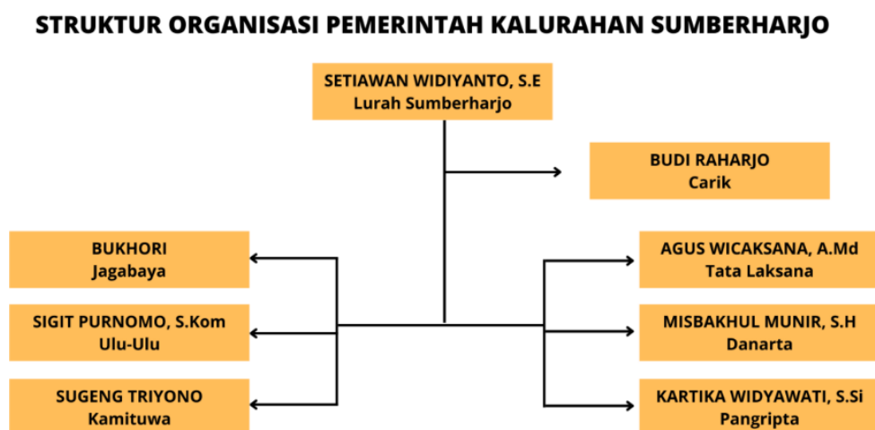
Gambar 3. Struktur Organisasi Kalurahan Sumberharjo